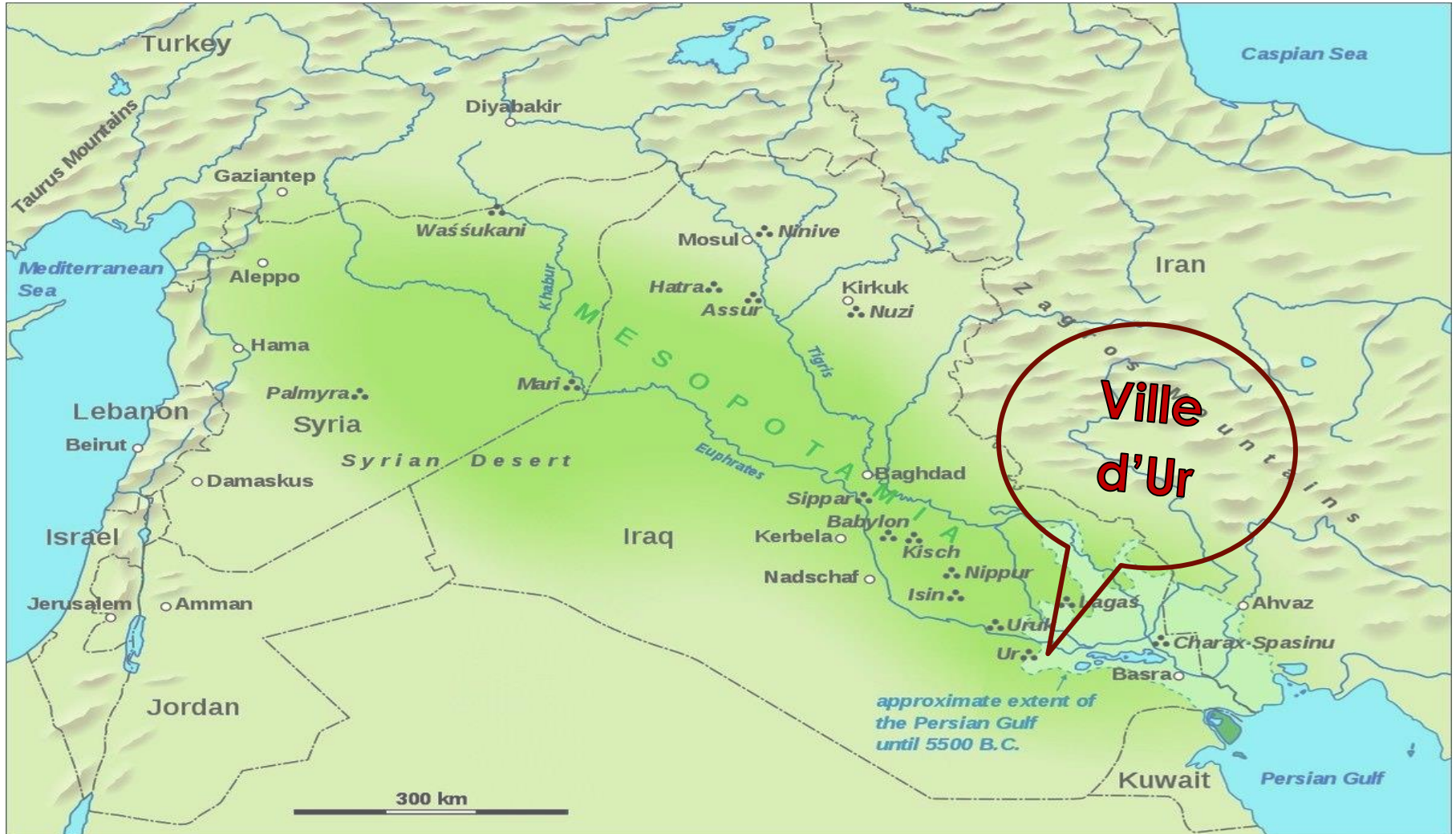
ILLUSTRATION 5 - MÉSOPOTAMIE