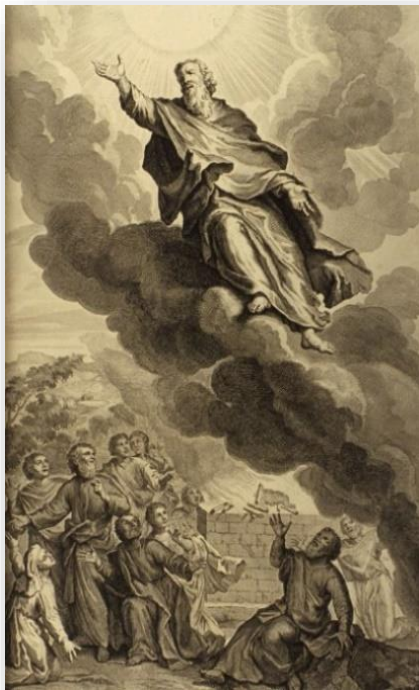
ILLUSTRATION 2 - HÉNOCH