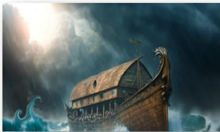
ILLUSTRATION 3 - ARCHE DE NOÉ

Hénoch (en hébreu : חֲנוֹךְ (ḥănōkh) ; en grec : Ἐνώχ (Henōkh) ; en latin : Enoch ; en arabe : إدریس (Idrīs)) est un patriarche biblique. Il est le fils de Yared aussi nommé (Jared) 4 , le père de Mathusalem et l'arrière-grand-père de Noé. Septième patriarche du lignage de Seth, il a selon le Livre de la Genèse vécu 365 ans avant que Dieu le prenne pour le placer au ciel 5 Hénoch « marchait avec Dieu » 1 , ce qui exprime une relation privilégiée avec Lui. Sa durée de vie terrestre, courte en comparaison avec les autres patriarches antédiluviens, suggère un lien avec l'année solaire de 365 jours. Il est une figure messianique préfigurant Élie et Jésus-Christ. Voir Livre d'Hénoch