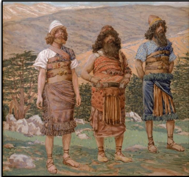
ILLUSTRATION 1 - DESCENDANTS DE NOÉ