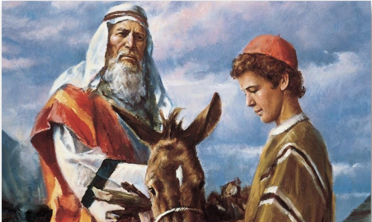
ILLUSTRATION 4 - ABRAHAM ET ISAAC